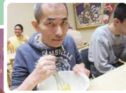
美味しくなれ!美味しくなれ! ちゃんと混ぜてる? みんな大好き、調理実習です。

入所利用していただく障がい者に対し、主に夜間に食事や排せつの介護、生活等に関する相談及び助言その他必要な日常生活の支援を行うほか、日中の実施サービスとして、生活介護事業を提供する施設です。