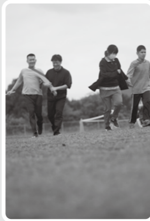
利用者さんはグラウンド2周！職員は50周…汗。

当園では秋の初イベント「やさリンピック」という運動会を企画。利用者さんが走ってドーナツを食べたり、タスキを繋ぐ駅伝に挑戦！係長の思いつきで企画になかった職員の参加もありました。利用者さん職員が一層盛り上がるイベントとなりました。