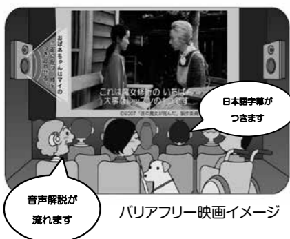
バリアフリー映画イメージ