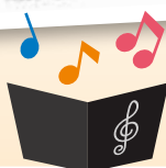
「ふれあい音楽祭2020」として、 特設ページを開設