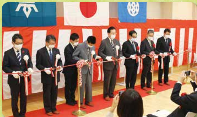
令和2年10月24日(土)「てしろもりの丘完成記念式典」の様子