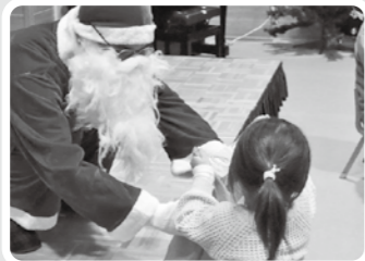
メリークリスマス！

和光学園では、毎年園内でクリスマス会が行われます。今年は新型コロナウイルス感染症の流行もあり、来賓は呼ばずに実施しましたが、子ども達の余興や、おいしい食事に、会場は大盛り上がりで、楽しいクリスマス会になりました。