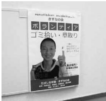
手作りポスターで普及活動

私たちがたばしね学園は「きずなの会」と称した自治会活動を行っています。その一環として今年から「小さなボランティア」という活動を始めました。月1回行われる集会で、児童達からボランティアの内容や日時について意見を募り実施しています。今年度の活動としては、寮棟内の窓ふき、床ふき、寮棟外の窓ふき、蜘蛛の巣取り、草取り、ごみ拾いを行っています。あさひ通り、のぞみ通りの児童達に写真撮影を依頼し、その写真を使用してのポスター作りも実施しており、それも児童達の楽しみのつになっています。