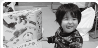
プレゼントもらったよ☆