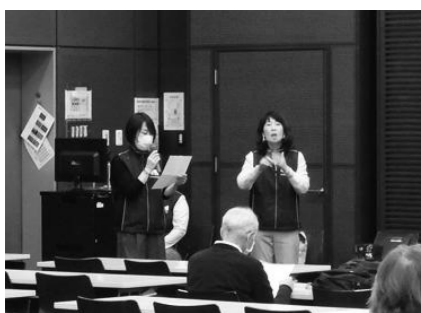
上映前の挨拶を手話通訳しています