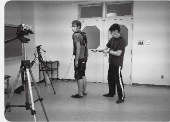
マッスルスーツの使い方を学んでいます。