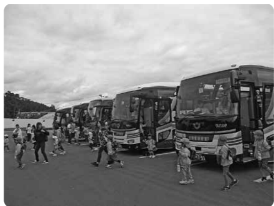
小百合幼稚園(宮古市)のみなさんと船越公園(山田町)へバス遠足。目の前に広がる公園に、子どもたちも駆けだしました。(H30.10.5)

東日本大震災いわて子ども支援センターは、平成23年3月11日に発生した東日本大震災津波により、壊滅的な被害を受けた岩手県の沿岸地域を対象として、遊びや体験を通して、被災地の子育て支援をおこなうため、岩手県から委託を受け、今年度まで当法人が運営してきましたが、この度、復興・創生期間が終了することにより令和3年3月31日をもって事業を終了することとなりました。 これまで実施してきた活動は、津波被害及び復興工事の影響で不足している遊びへの対応として大型遊具等を設置した室内型遊び場の開催や、保育所を中心とした遊びを体験するためのバス遠足支援のほか、被災地に勤務する保育支援者を対象とした保育技術の向上とストレス軽減等の研修会、仮設で暮らす親子や仮設園舎等で生活する園児を対象とした講座等に関係機関と連携し、継続して