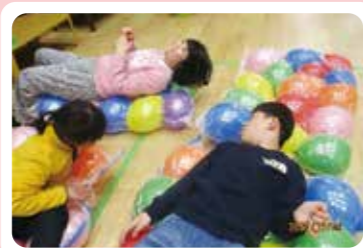
風船ベッドでねてみたよ♪

授業の終了後又は学校の休業日に、デイサービスセンターに通っていただき、生活能力の向上のために必要な訓練、社会との交流の促進その他必要な支援を行う事業所です。