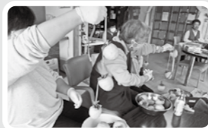
利用者が講師となり干し柿作り