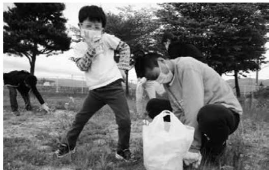
おいちゃん、がんばれ!

児童達からは「他の寮棟の子どもと一緒でできて楽しい」「窓ふきとか普段できないので貴重な体験になっている」「自分もポスターに載せて欲しい」との言葉も聞かれています。嫌々活動に参加する児童はおらず、皆、前向きに取り組んでいるのがとても印象的です。また、児童達からは地域に出てゴミ拾いや草取りをしたいとの要望もでており、今後地域に進出し、活動の幅を広げていけたらと考えていま