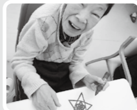
きれいに塗れたよ～

地域公益活動として、利用者の皆さんと一緒にステンドグラス風の飾りを作り、昨年より奥中山高原駅の窓を装飾させていただいています。今年は銀河鉄道の「銀河」をイメージし、星形にしてモビールを作りました。駅を利用される皆様に楽しんで頂けたらと思います。