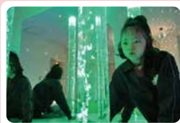
この光...見入ってしまう♪

「あっぷるぱい」・・・リンゴの赤色から元気、パイの網飾りから職員のチームワークを表しています。アップルパイの美味しさのように、幸せな気持ちを感じられ、利用者様が安心できる場所を目指してまいります。