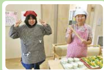
調理実習楽しかったです!美味しそう~!!

利用者の皆さんはユニットで個室となり、落ち着いた環境の中で伸び伸びと生活しています。今後も一人ひとりへのよりよい、社会とのつながり、健やかなはぐくみを大切に、児童が安心して成長できるよう職員一同努めてまいります。