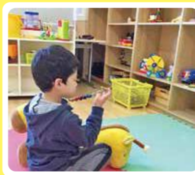
おもちゃに夢中です!!

てしろもりの丘のおもちゃ図書館では、様々なおもちゃで子どもたちが日々思い思いの遊びを楽しんでいます。地域の皆様への一般開放に向けて準備が整いましたら、ホームページ等でお知らせして参ります。