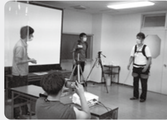
研修の様子を撮影しています。