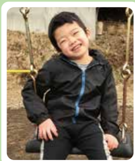
ブランコ楽しいね!!

障がい児の入所利用施設であり、日常生活の指導及び自立生活に必要な知識技能の付与を行うことを目的とした施設です。