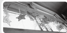
奥中山高原駅の待合室に飾りました。