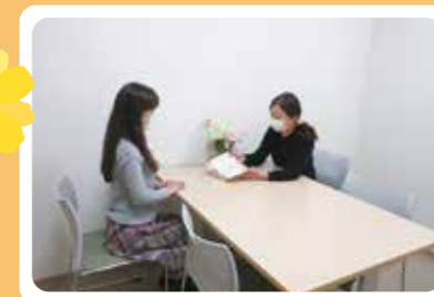
たくさんお話を聞かせて下さい!!

相談支援事業所「らいふ」です。盛岡市と矢巾町にお住いの方で、障がいサービスを利用する幼児から高齢者までの幅広い年代の方を対象にしています。希望する生活が送れるように一緒に考えていきたいと思っております。