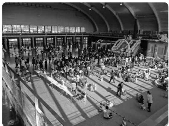
久慈市で開催された、室内型遊び場わんぱくひろば100回記念イベントには、736人も参加者が集まりました。(H29.11.4)