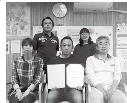
つつじのみなさんおめでとうございます!!