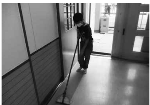
窓や床を丁寧に磨きました。

児童達からは「他の寮棟の子どもと一緒でできて楽しい」「窓ふきとか普段できないので貴重な体験になっている」「自分もポスターに載せて欲しい」との言葉も聞かれています。嫌々活動に参加する児童はおらず、皆、前向きに取り組んでいるのがとても印象的です。また、児童達からは地域に出てゴミ拾いや草取りをしたいとの要望もでており、今後地域に進出し、活動の幅を広げていけたらと考えていま