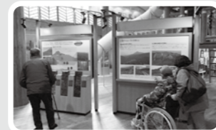
八幡平市内への社会見学

「ひこうせんいわて」「ふらっと」を紹介します。地域活動支援センターは岩手町、八幡平市から委託された地域で暮らす障害のある方が誰でも利用できる活動の場です。二つの事業所では、利用者の声を取り入れた活動を行っています。