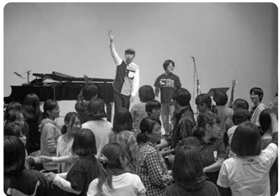
シンガーソングライターの新沢としひこ氏による保育支援者研修会「歌がもたらす 心の栄養」 優しくパワフルな歌声に、たくさんの元気をいただきました。(H27.10.10)