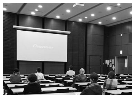
広い会場でソーシャルディスタンスを保ちました

今年度は11月29日(日)に開催し、「長いお別れ」という作品を上映しました。参加した方からは「音声ガイドは初めての体験だったが、全然気にならなかった」「もっとバリアフリーの作品が増えるといい」といった声をいただきました。 今後も、障がいの有無にかかわらず、皆で楽しめるバリアフリー映画会を開催していきたいと考えています。