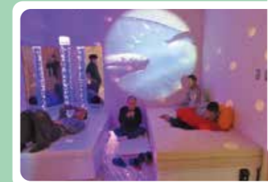
スヌーズレン室でリラックスタイム!! 綺麗だね。

知的障がい者の重度棟で、計30名の方が入所利用されています。リンゴ畑に囲まれた閑静な環境の中、毎日賑やかなながらも、広々とした居住空間でゆったりとした日々を送っています。