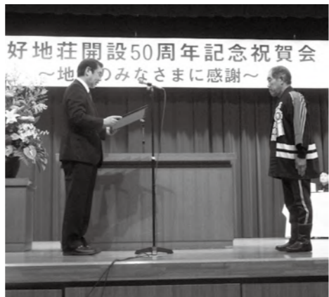
50周年記念式典の様子。理事長から感謝状が贈られました。

さらに、地域生活を希望する利用者に対しては、居宅生活訓練事業や保護施設通所事業などを通して、地域における自立生活の実現に向けた支援を続けるとともに、多様な障がい有する在宅の要保護者の積極的な受け入れを図るなど、救護施設としてのセーフティネット機能の充実に努めてきま