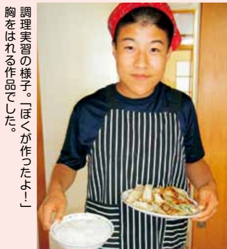
調理実習の様子。「ほくが作ったよ！」胸をはれる作品でした。

が、冷凍食品には野菜が少なく、味付けも同じでは、味覚が育ちません。たばしね学園では、児童一人ひとりの嗜好や偏食などを理解したうえで食事を考え、厨房職員は、児童の「おいしかったよ」の笑顔を最高の励みに、旬のおいしさと手作りのおいしさ、それに愛情が入った給食を日々児童に届けています。