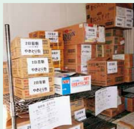
備蓄庫には3日分の食料を保存しています。

「思いやりの食事」をモットーに、今後新しい技術の獲得や、食材の選択、調理方法の工夫と研究を重ねていきたいと思えます。