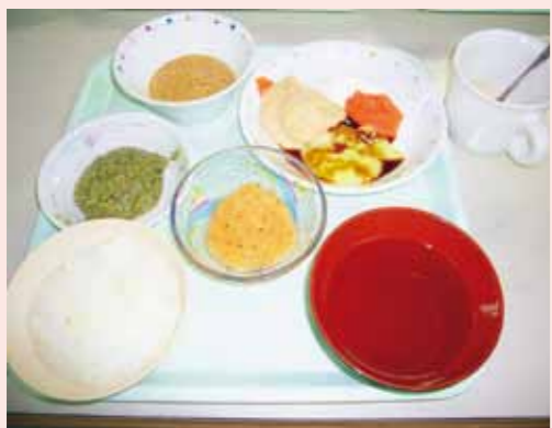
中山の園グループにおいて提供しているブレンダー食。

厨房からの食事提供形態は、糖尿病、高血圧症、脂質異常症などの疾患による個別対応食に加え、摂食・嚥下障害に配慮したものとなっております。その内訳は、ブレンダー食15人、超きざみ食12人、粗きざみ食83人、普通食100人で、高齢化などにより、きざみ食への移行が増加しています。