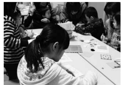
みんなで一緒に作品づくり

そこで、子どもの森では、いろいろな遊び体験をとおして、子どもたちが孤立することなく、家族や地域の方々と一緒に楽しい時間をもってもらいたい