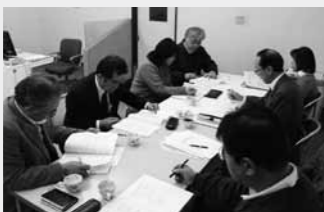
復興支援センター会議の様子。課題への対応について協議しています。

では、調査で明らかになった課題を可能な限り支援につなげ、また福祉避難所や地域に即した障がい対応マニュアルを作成するとともに、各障がい福祉サービス事業所の活性化につながる支援をしていきたいと考えております。