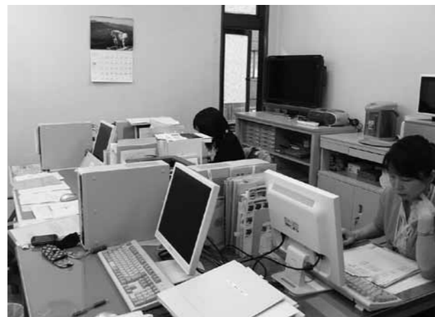
発達障がい沿岸センターの様子

〈はじめに〉 当センターは、県から「被災地発達障がい児支援体制整備事業」の委託を受けて、この4月に釜石市に開設されました。スタッフは相談員2名と事務員1名の計3人体制で、岩手県発達障がい者支援センターウィズと連携し、①相談支援(本人・家族・機関等)、②機関支援(各機関への協力)、③研修会への協力などを、活動の柱として、発達障がいに関する支援を、沿岸地域で展開しています。