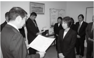
金賞を受賞した「共同生活事業所みたけの園」立花主任生活支援員。

本年度においても、各施設で積極的な取り組みがなされているところであり、今後も制度の実施をとおして、職員や施設の主体的な問題解決能力を高め、法人全体の経営改革の推進を図ってまいります。