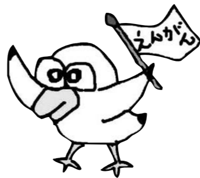
ココ 沿岸センターキャラクターのカモメ 個々と心と場所のココを意味します。