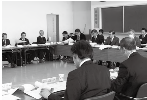
プロセスマネジメント会議の様子。中長期経営基本計画の着実な推進を図っています。

を図り、東日本大震災復興対策の3事業受託を始め、相談支援事業の充実、新たな市町村事業の受託、ケアホームの新設など、事業団の多様な専門機能を生かし、積極的に挑戦しています。広域的に多様な施設と幅広いサービス・人材を有する事業団の強みを生かし、地域ニーズに即応したサービス提供と地域福祉の一層の推進を図るため、エリア毎の施設連携体制の強化が必要と感じています。