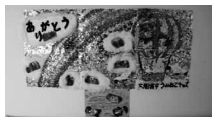
手づくりのメッセージをいただきました

そびにコンビニ」(地域共催型移動児童館)の実施や、岩手県社会福祉協議会児童館部会が主催する「いわて子どもあそび隊」への参加など、被災地の子どもたちへの遊びの提供などの活動も、継続して行っております。