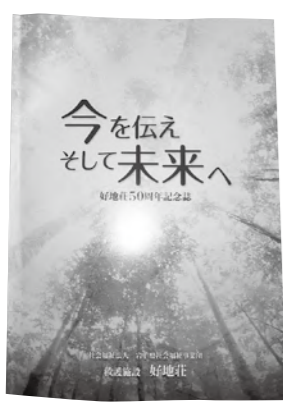
50周年記念誌を発行しました。