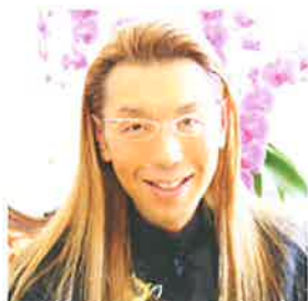
假屋崎省吾 Shogo Kariyazaki 華道家