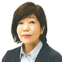
林 真理子 [審査委員長] Mariko Hayashi 作家