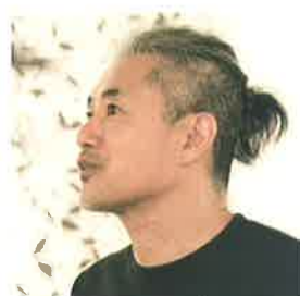
中津川浩章 Hiroaki Nakatsugawa アーティスト/アートディレクター

1954年4月1日、山梨県に生まれる。1976年日本大学芸術学部文芸学科を卒業。コピーライターを経て、1982年エッセイ集「ルンペンを買っておうちに帰ろう」を出版。1984年処女小説「星影のステラ」が直木賞候補に選出されたことを機に、執筆業に専念。1985年「最終便に間に合えば」[京都まで]により第94回直木賞を受賞。1995年「白蓮れんげん」により第8回柴田錬三郎賞を受賞。1998年「みんなの秘密」により第32回吉川英治文学賞を受賞。2000年直木賞選考委員に就任。他、数々の文学賞の選考委員を務める。2011年レジオン・ドヌール勲章シュヴァリエ受賞。2013年「アスクレピオスの愛人」により第20回島清恋愛文学賞を受賞。2018年紫綬褒章受章。「2020(令和2)年、第68回菊池寛賞受賞、また「同一雑誌におけるエッセーの最多掲載回数」においてギネス世界記録認定を受ける。」