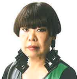
コシノジュンコ Junko Koshino デザイナー